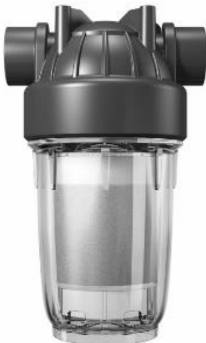
арт. 750 001