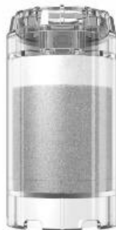
арт. 750 002