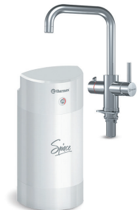
Мультипот система кипячения питьевой воды