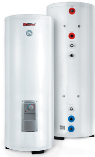
Комбинированные (кос- венные) водонагреватели