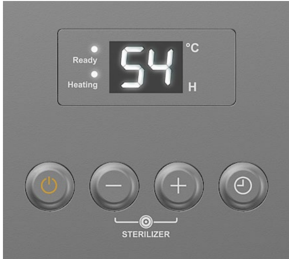
Рисунок 2. Панель управления

Включение/выключение ЭВН осуществляется нажатием кнопки « \text{⏻} ». В процессе эксплуатации ЭВН потребитель может регулировать температуру нагрева нажатием соответствующих кнопок «-» и «+» на панели управления. После однократного нажатия клавиш «-» и «+» температура снижается/повышается на 1°C.