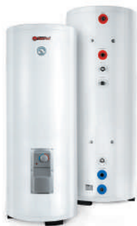
Комбинированные (кос- венные) водонагреватели