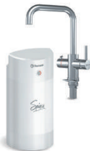
Мультипот система кипячения питьевой воды