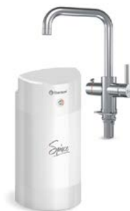
Мультипот система кипячения питьевой воды