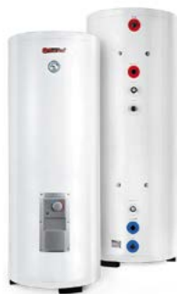
Комбинированные (кос- венные) водонагреватели