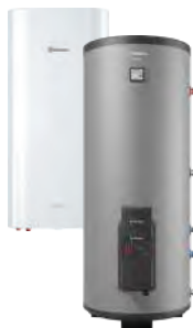
Комбинированные (косвенные) водонагреватели