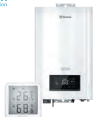
Электрические котлы и комнатные термостаты