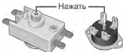
Рисунок 3. Возможные схемы расположения кнопки термовыключателя