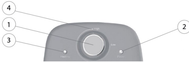
Рисунок 2. Механическая панель управления, где 1 – механический регулятор нагрева, 2 – контрольная лампа «Power» для обозначения включения/выключения водонагревателя, 3 – контрольная лампа «Heating» для обозначения нагрева, 4 – температурная шкала.

Включение/выключение ЭВН осуществляется поворотом стрелки индикатора на ручке управления из зоны «Low» в зону «High» (Рис. 2, п.4). В процессе эксплуатации ЭВН потребитель может регулировать температуру нагрева поворотом стрелки на механическом регуляторе температуры (Рис. 2, п.1) на панели управления.