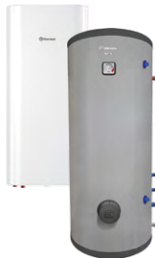
Комбинированные (косвенные) водонагреватели